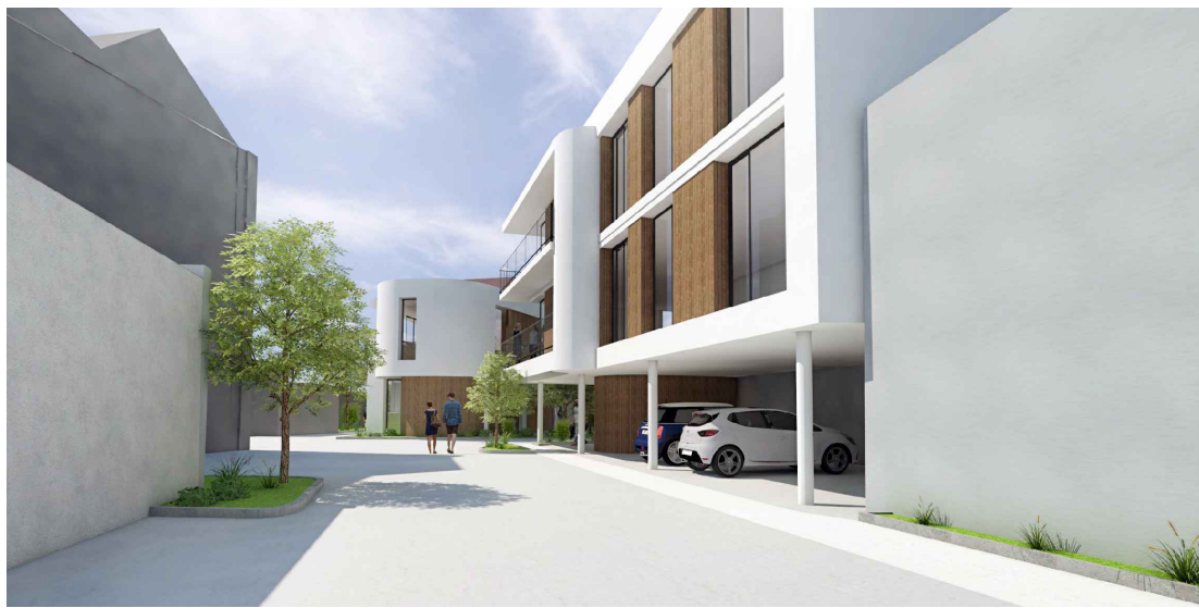
Esquisse 3D projet