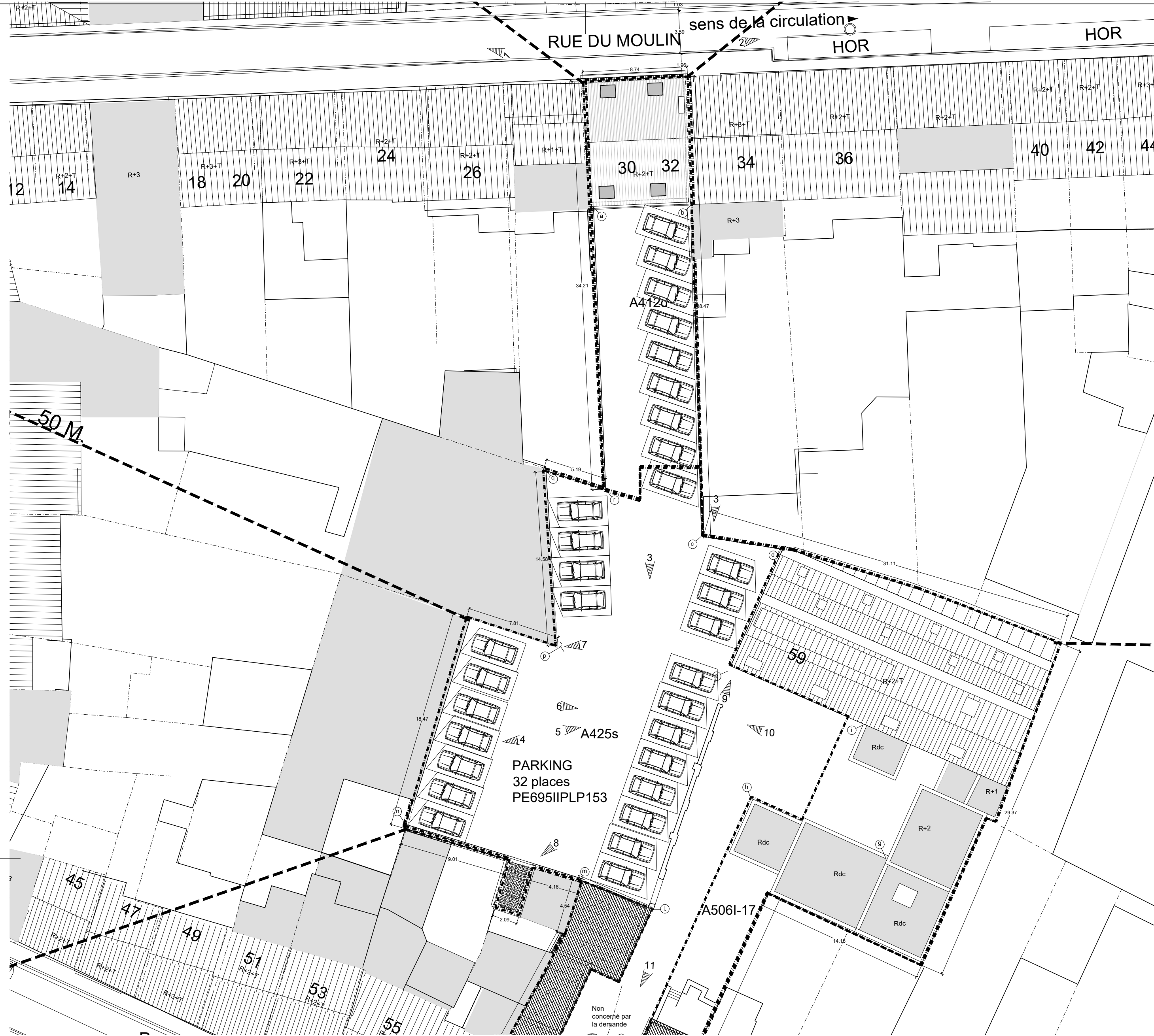
IMPLANTATION EXISTANTE Echelle 1/250